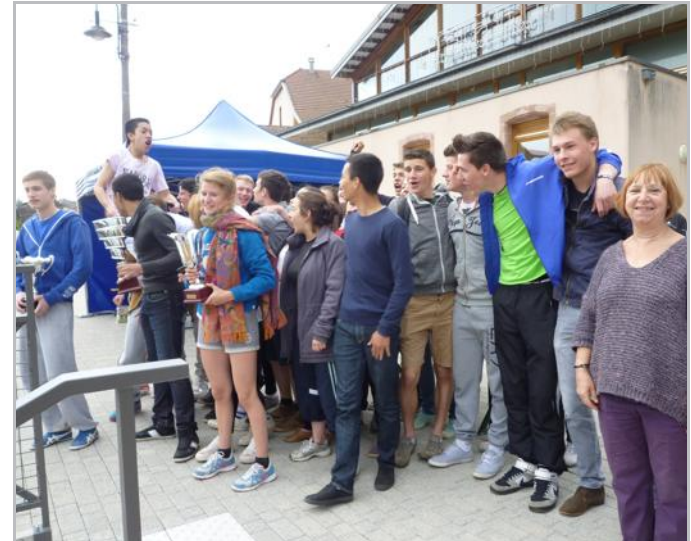
La délégation du lycée Poincaré de Bar-le-Duc sur la première marche du podium, suivie par celle du lycée Majorelle de Toul.

■ Le classement final : 1. Lycée Poincaré Bar-le-Duc ; 2. Majorelle Toul ; 3. Vogt Commercy ; 4. Haie Griselle Gérardmer ; 5. Schumann Metz.